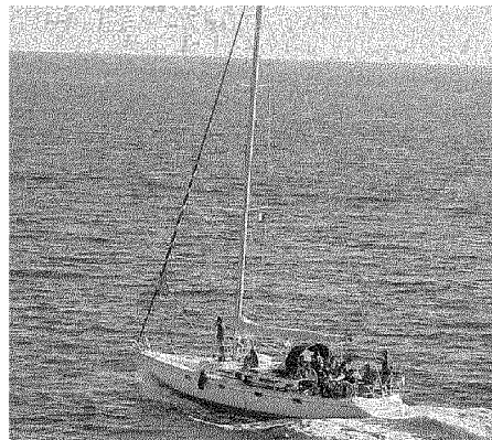
Il momento dello sbarco dei migranti ieri mattina a Otranto. A destra la barca ancora in mezzo al mare